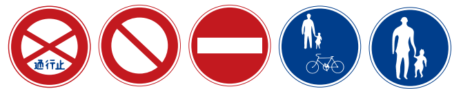
Road closed 通行止め, Closed to all vehicles 車両通行止め, No entry 車両進入禁止, Bicycles and pedestrians only 自転車及び歩行者専用, Pedestrians only 歩行者専用

Rental cars are not permitted to travel in lanes which are set aside for buses or bicycles, which may be designated by signs such as the following: