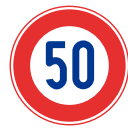
Maximum speed limit 最高速度

全ての道路に最高速度が定められています(道路標識等により最高速度が指定されていない場合、一般道路は60km/h、高速道路は100km/h)。最高速度を遵守して安全運転をお願いします。なお、警察官や速度違反自動取締装置による取締りが行われています。